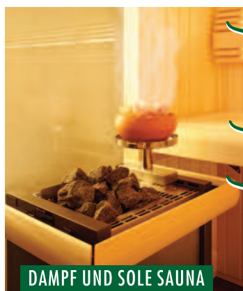
DAMPF UND SOLE SAUNA

→ Aktions- und Musterkabinen stark reduziert.