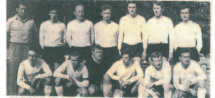
Die Fußballer des Grieskirchen... (Caption text describing the team photo and match details)