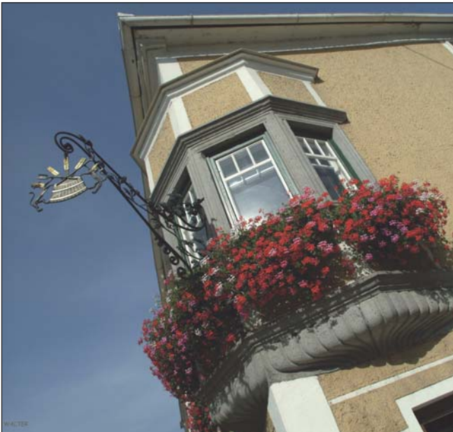
Brauereigebäude mit Zunftwappen

Wir Österreicher bleiben konstant starke Genießer – immer noch liegen wir bei 106 Liter Bierverbrauch pro Kopf im Jahr. Haben wir doch auch guten Grund dazu. Schließlich sind wir gesegnet mit besten Rohstoffen, kristallklarem Wasser und tüchtigen Brauereien, die es zu schätzen wissen, diese Kostbarkeiten in ausgezeichnetes Bier zu verwandeln. So auch die GRIESKIRCHNER Brauerei. Seit 1708 sehen es die Mitarbeiter der Brauerei als ihre persönliche Pflicht, die Region mit bestem Bier zu versorgen. Es spiegelt die Seele von Grieskirchen und die Leidenschaft der Menschen wider, die es brauen.