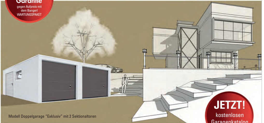
Modell Doppelgarage "Exklusiv" mit 2 Sektionaltoren

JETZT! kostenlosen Garagenkatalog anfordern!